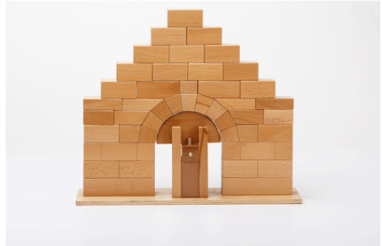
Bild: Montessori Lernwelten: Römische Brücke, https://www.montessori-material.de/montessori-material/praktisches-leben/roemische-bruecke/a-546/